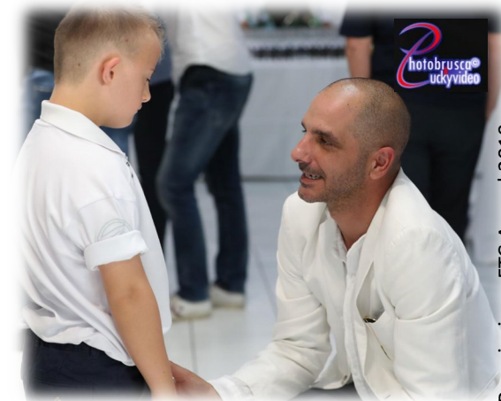
Premiazione FTC Award 2019